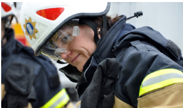
RAP - Ren arbetsplats och rena yrkeskläder.

Förbundet utför ovanstående uppgifter genom att bryta ner uppdraget i mål och prestationer vilka dokumenteras och följs upp i en verksamhetsplan.